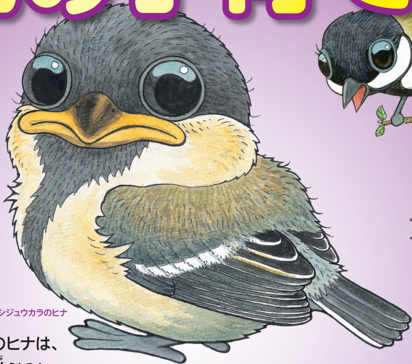
シジュウカラの子