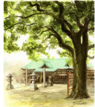
2007年大木冊子表紙絵 ⑨泉殿宮クスノキ(安芸佐穂子氏画)