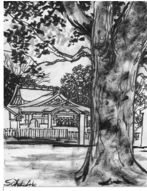
2007.6吹田の郷表紙 ⑩片山神社クスノキ (安芸佐穂子氏画)