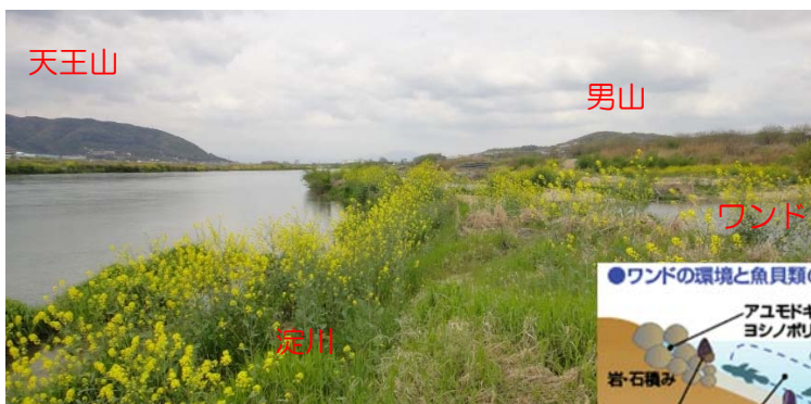
楠葉ワンドより上流を望む（春）