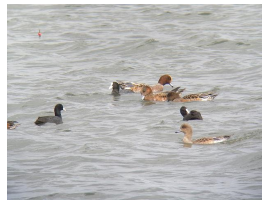
ヒドリガモとオオバン