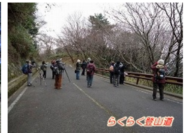
ぼくらの広場での探鳥風景