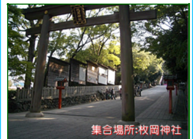
集合場所:枚岡神社