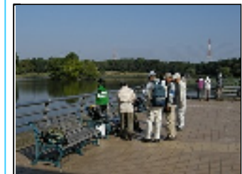
集合場所付近の状況