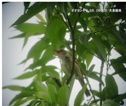
このページの写真はクリックすると拡大して見ることができます。

大泉緑地は大阪府4大緑地の一つで、堺市北区にあります。約200種32万本もの樹木が植えられており、市街地の緑のオアシスです。3つの池と水流、丘陵、落葉樹林など、変化に富んだ地形は鳥たちの絶好の棲家・休息地となっています。定例探鳥会では、公園を1周しながら、水辺の野鳥・森林性の野鳥を探します。カワセミや、冬季にはオオタカを間近で見ることができるかもしれません。