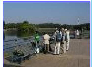
集合場所付近の状況