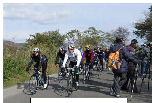
12/7 自転車部隊と遭遇

右写真は12月、自転車が10数台連ねて通った時の状態、近づく一触即発です。怪我をするのはバードウォッチャー、保険に入っても痛みまでは補償されません。今回は堤防のサイクリング道路ですので、充分注意をお願いします。