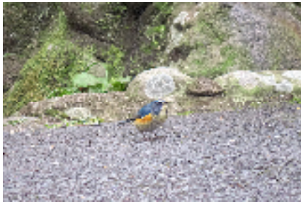
ルリビタキ (2015. 1. 10)

展望台や「ぼくらの広場」では大阪平野から遠くは明石海峡まで見渡せるほか、季節によって梅・桜・あじさいの花や紅葉なども楽しむことができる探鳥地です。