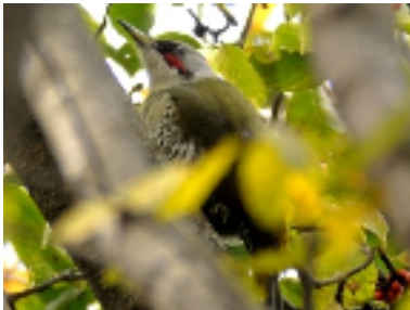
アオゲラ (2013. 11. 9)

展望台や「ぼくらの広場」では大阪平野から遠くは明石海峡まで見渡せるほか、季節によって梅・桜・あじさいの花や紅葉なども楽しむことができる探鳥地です。