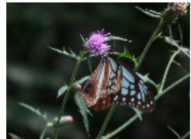
アサギマダラ (2013. 10. 12)