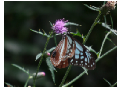
アサギマダラ (2013. 10. 12)