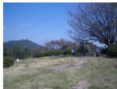
アオゲラ (2013. 11. 9)