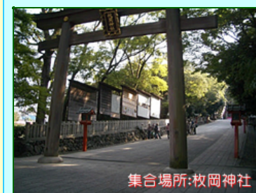
集合場所:枚岡神社