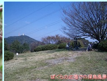
ぼくらの広場での探鳥風景