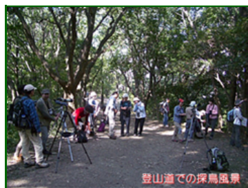
登山道での探鳥風景