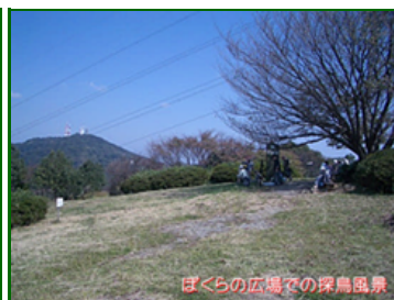
ぼくらの広場での探鳥風景