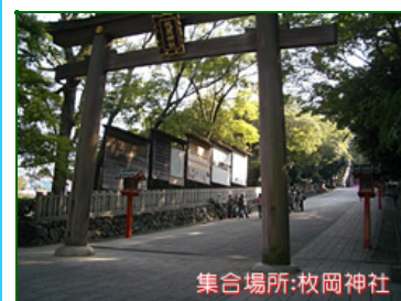
集合場所:枚岡神社

集合場所： 近鉄奈良線 枚岡駅下車 枚岡神社鳥居前 時間：9:10 ~ 15:00