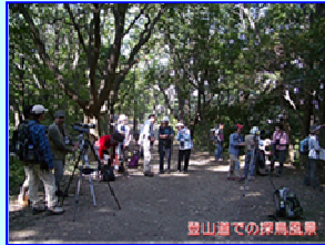
登山道での探鳥風景