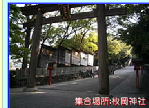
集合場所:枚岡神社