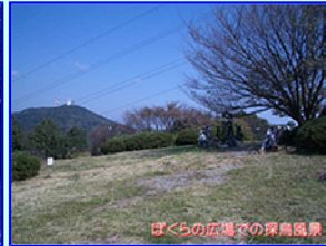
ぼくらの広場での探鳥風景