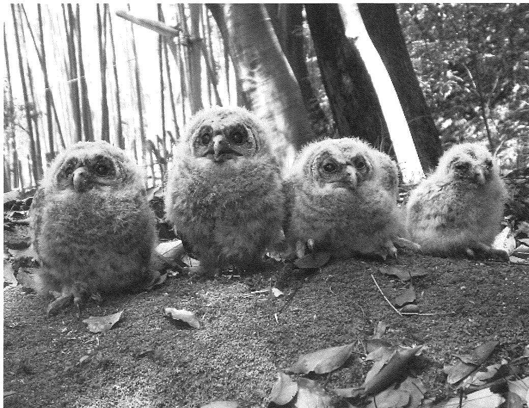
写真1 フクロウのひな（大東4兄弟）

申し込み用紙の様式もそこに置いてありますので、Emailでのお申し込みの際にご利用ください。なお当面は関係者用のページですので、一般への紹介やリンクはご遠慮ねがいます。