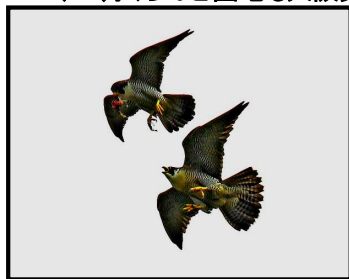
20210320 河村 壽氏