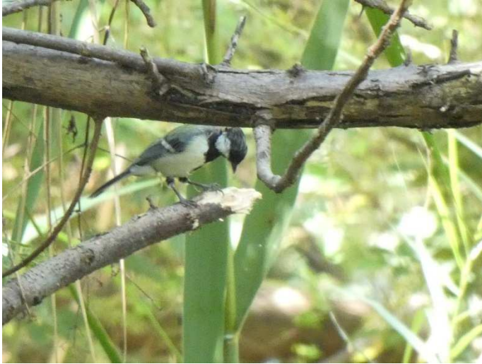
↑シジュウカラ(西脇淳浩) 20230903

伐採が実施されると観察できなくなるとされる林の小鳥はコゲラ・シジュウカラ・メジロなど、トータル26種にとどまった。予報通り暑い日であったが、全員元気で探鳥会を終了することができた。