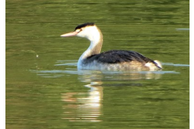
カンムリカイツブリ