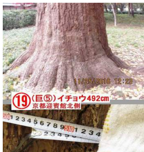
(19) (巨⑤) イチョウ492cm 京都迎賓館北側