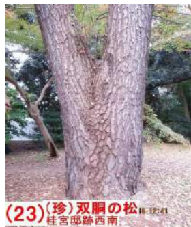
(23) (珍) 双胴の松 桂宮邸跡西南