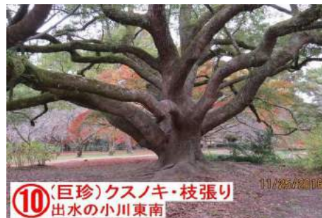
⑩ (巨珍)クスノキ・枝張り 出水の小川東南