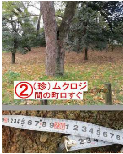
② (珍)ムクロジ 間の町口すぐ