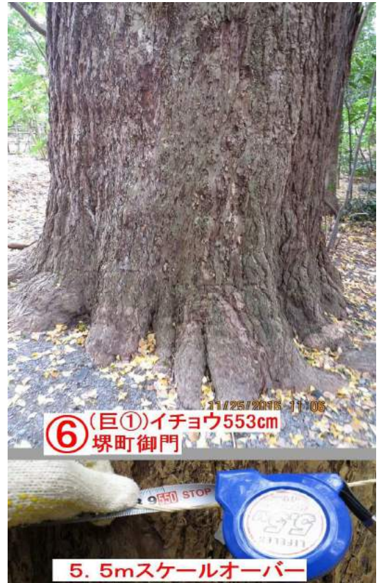
⑥ (巨①)イチョウ553cm 堺町御門