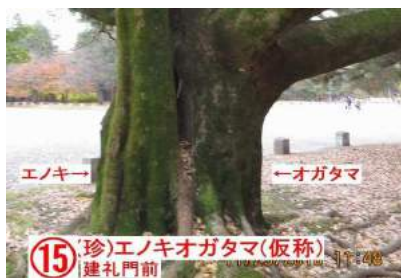
(15) (珍) エノキオガタマ(仮称) 建礼門前