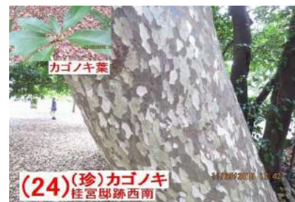
(24) (珍) カゴノキ 桂宮邸跡西南