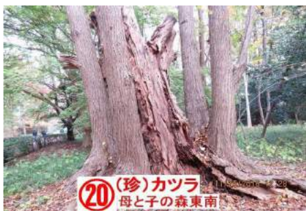
(20) (珍) カツラ 母と子の森東南