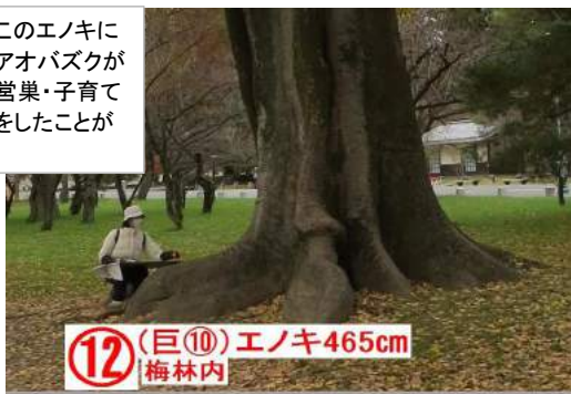
(12) (巨⑩) エノキ465cm 梅林内