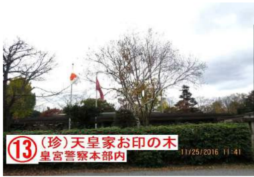
(13) (珍) 天皇家お印の木 皇宮警察本部内