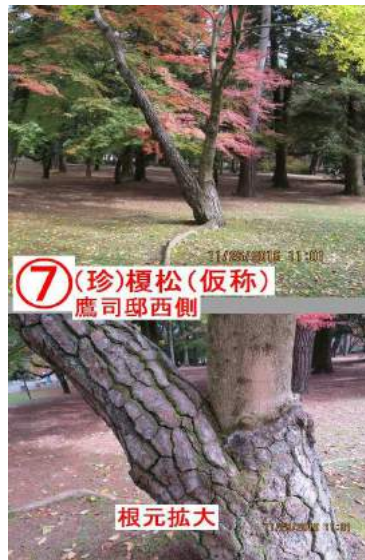
⑦ (珍)榎松(仮称) 鷹司邸西側