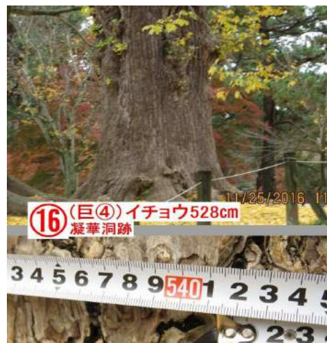
(16) (巨④) イチョウ528cm 凝華洞跡