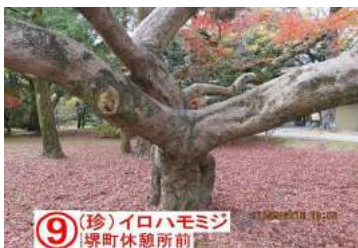
⑨ (珍)イロハモミジ 堺町休憩所前