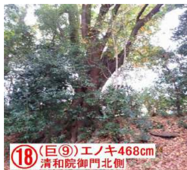
(18) (巨⑨) エノキ468cm 清和院御門北側