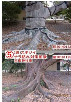
⑤ (珍)スタジイ ナラ枯れ対策前後 宗像神社東