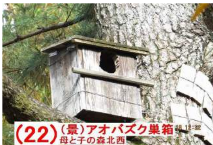
(22) (景) アオバズク巣箱 母と子の森北西

シジュウカラ・メジロなど留鳥、ルリビ タキなどの冬鳥が水を飲みに来るの で、カメラマンのポイントになってい