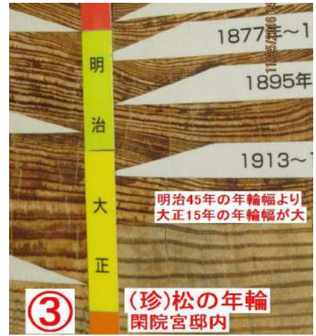
③ (珍)松の年輪 閑院宮邸内