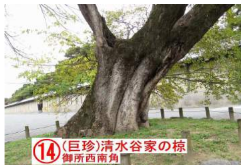
(14) (巨珍) 清水谷家の榎 御所西南角

エノキオガタマ(仮称) 写真で見ると根元は1本 ですが、落葉エノキと常 緑オガタマノキがくっつい ています。↓