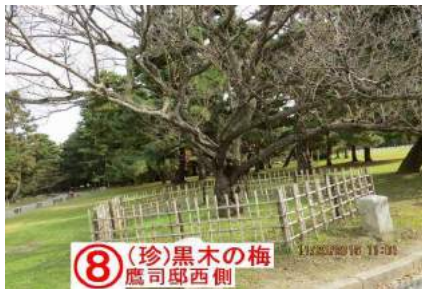
⑧ (珍)黒木の梅 鷹司邸西側