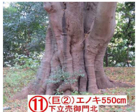
⑪ (巨②)エノキ550cm 下立売御門北