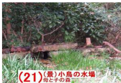
(21) (景) 小鳥の水場 母と子の森