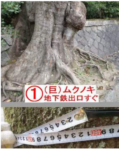
① (巨)ムクノキ 地下鉄出口すぐ