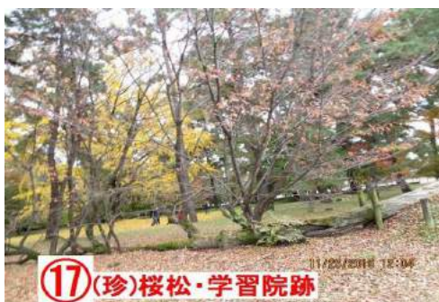
(17) (珍) 桜松・学習院跡