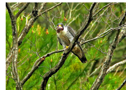
②餌をくわえ求愛給餌