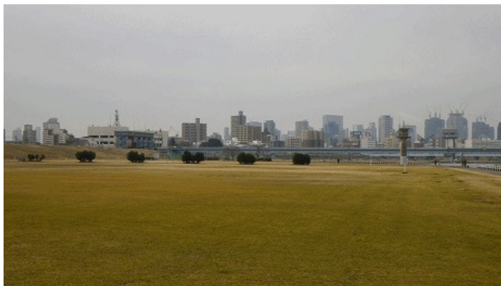
毛馬の淀川大堰（淀川にも堰があります。）