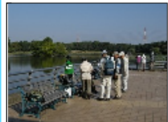
集合場所付近の状況