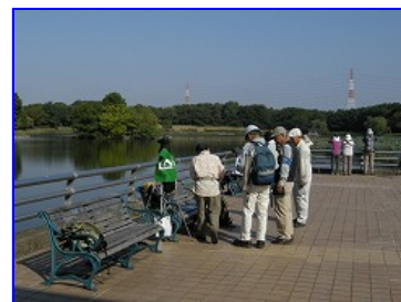
集合場所付近の状況