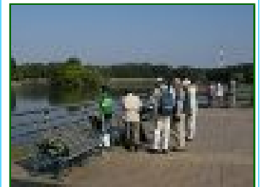
集合場所付近の状況