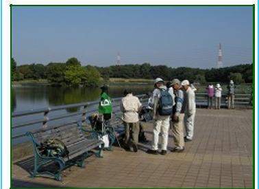
集合場所付近の状況