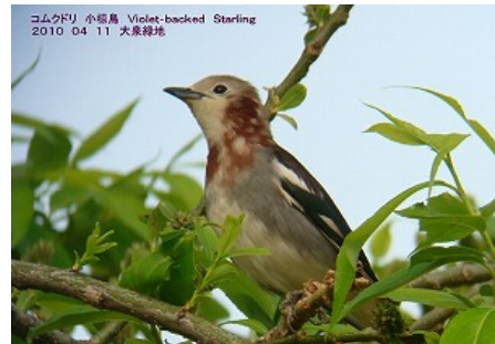
このページの写真はクリックすると拡大して見ることができます。

大泉緑地は大阪府4大緑地の一つで、堺市北区にあります。約200種32万本もの樹木が植えられており、市街地の緑のオアシスです。3つの池と水流、丘陵、落葉樹林など、変化に富んだ地形は鳥たちの絶好の棲家・休息地となっています。定例探鳥会では、公園を1周しながら、水辺の野鳥・森林性の野鳥を探します。カワセミや、冬季にはオオタカを間近で見ることができるかもしれません。